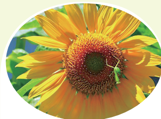
人権の花運動 ひまわり 洗切小学校