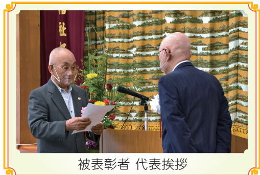
被表彰者 代表挨拶