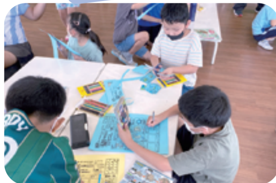
由木学童保育所 「由木ファクトリー」

「店員とお客さんに分かれて、おしゃれなカフェでおやつにしました。おもてなしの気持ちを持って丁寧に接することができました♪」