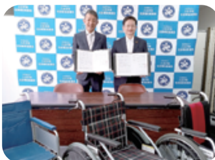
協定調印式の様子

良き企業市民として、自社の経営資源を活用しながら、地元八王子に寄り添った地域貢献活動は大変頼もしく、心より感謝申し上げます。