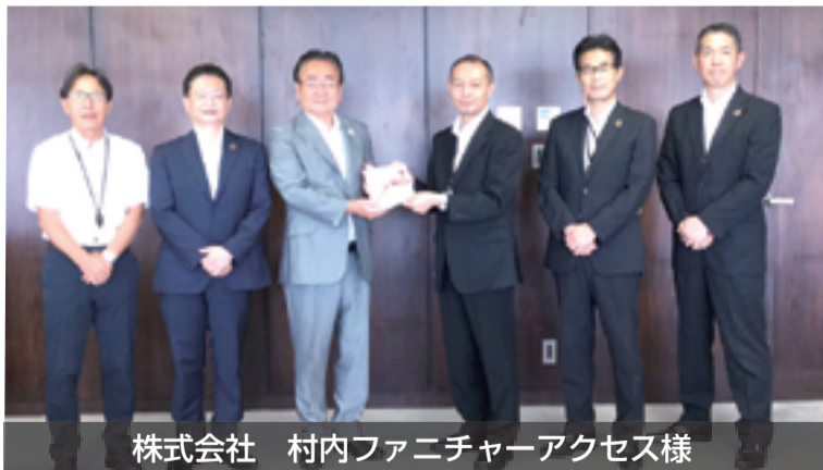
株式会社 村内ファニチャーアクセス様