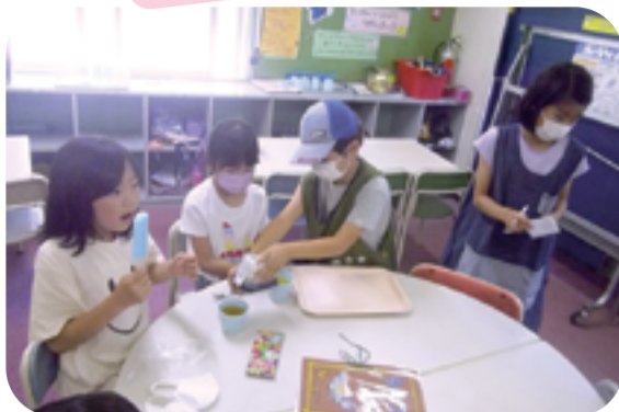
宮上学童保育所 「うずまきカフェ(店員体験)」

「店員とお客さんに分かれて、おしゃれなカフェでおやつにしました。おもてなしの気持ちを持って丁寧に接することができました♪」