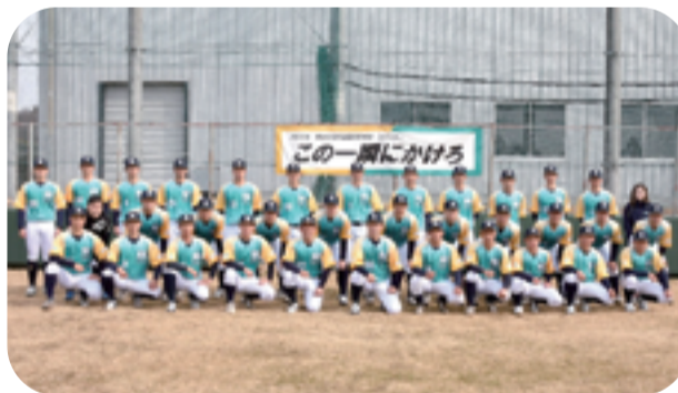
明治安田生命硬式野球部の皆さん

今後もさらに絆を深め、有事の際はもとより、八王子の地域活性化を共に推進していければと考えています。