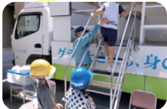
大和田小学童保育所 「起震車&アルファ化米体験」

「今まで感じたことのない揺れに、子どもたちは恐がりながらも、貴重な体験をしました。その後、非常食のアルファ化米を食べました。」