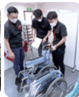
修繕ボランティア活動の様子

問合せ 市民力支援課(ボランティアセンター) ☎ 042-648-5776 FAX 042-648-6332