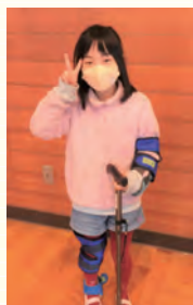
ひじやひざが曲がりにくなるサポーターと重りを装着して、階段の上り下りを体験

犬飼小学校の4年生18名が“みんなができることって何だろう”をテーマに高齢者疑似体験と車椅子体験をしました。疑似体験では高齢者の気持ちになってもらうため、サポーターやゴーグルなどを装着して体験しました。次に車椅子の使い方を学習し、介助する人と乗る人の両方を全員が体験しました。体の不自由な人の気持ちを知ること、どんな手助けができるのかを一緒に考えることができました。体験して学んだことをこれからの生活に活かして、たくさんの人を笑顔にしたいと思います。