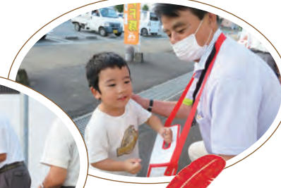
三重町仏教会から