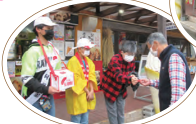
朝地中学校生徒から