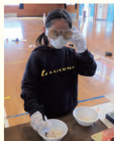
特殊なゴーグルを装着して基石の移動に挑戦