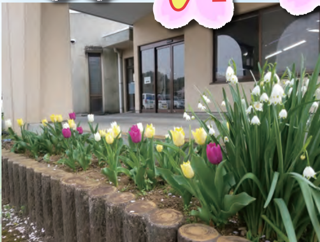
職員と利用者さんで花を植えています