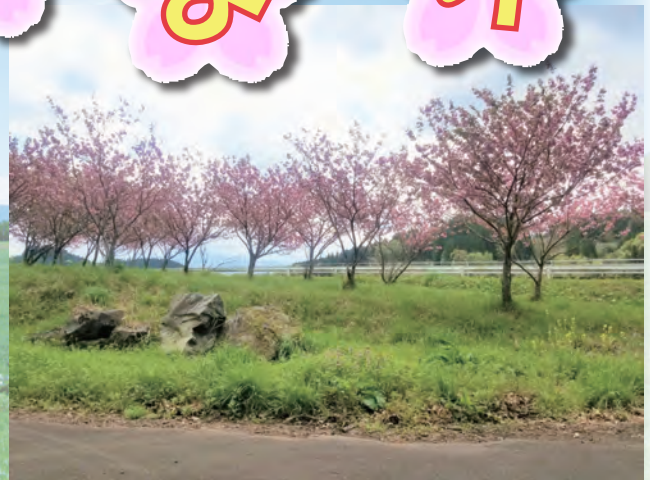
(写真は昨年のもので)