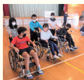
いきなり動かせないで、ひとつひとつの声かけが大事だよ