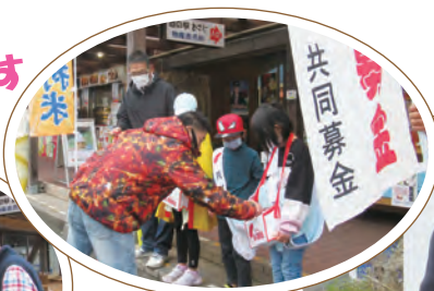
双葉保育園・扇田保育園 の園児から