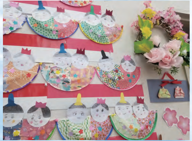
デイサービス悠々で雛飾りを作りました