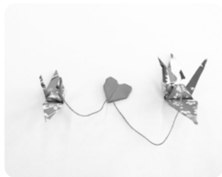
▲“おりづる”さんによる「親子鶴」

“おりづる”さんは、H15年から八日市地区で活動されている折り紙サークルです。『さぼてんのはな』さんより、「子どもを火葬する時に何か一緒に送ってあげたいと思っていたらハートピアで素敵なおりづる作品を見つけました。繋いでもらうことはできないか」との声を受け、ご協力いただくことができました。