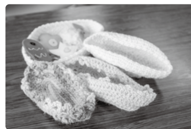
▲“赤ずきんちゃん”さんによる「ゆりかご」

「小さな赤ちゃんはとても不安定で、抱っこするのが難しいと聞き、優しく包み込めるようなゆりかごを作りました」