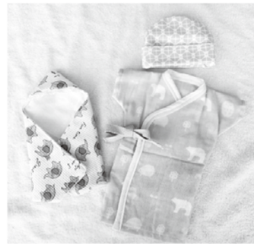
▲小さなベビー服とおくるみ

『さぼてんのはな』さんより、「ベビー服やおくるみを、ほしい方に届けたいけれど、自分たちだけでは縫えない」との相談を受け、R2年5月に社協が取り組んだ“手作りマスクと元気を届けようプロジェクト”のボランティアさんはじめ多くの方にご協力いただきました。延べ、24名100着以上のベビー服とおくるみが出来ました。