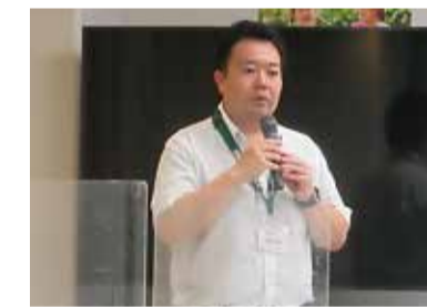
▲7月テーマ「医師との上手な付き合い方」