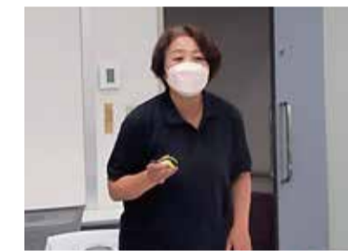
▲5月テーマ「訪問看護のお仕事について」

参加者からは「介護するうえで心構えを学ぶことができた」、「ほかでは教えてもらえない話を聞くことができた」など多くの感想が寄せられ、講座終了後の交流会ではそれぞれの近況など思い思いに語り合うことができました。