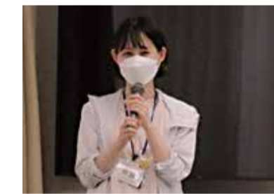
▲9月テーマ「バランスのよい栄養の取り方」