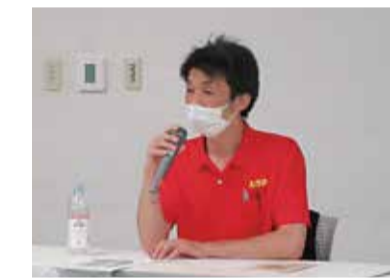
▲6月テーマ「認知症の方への接し方」