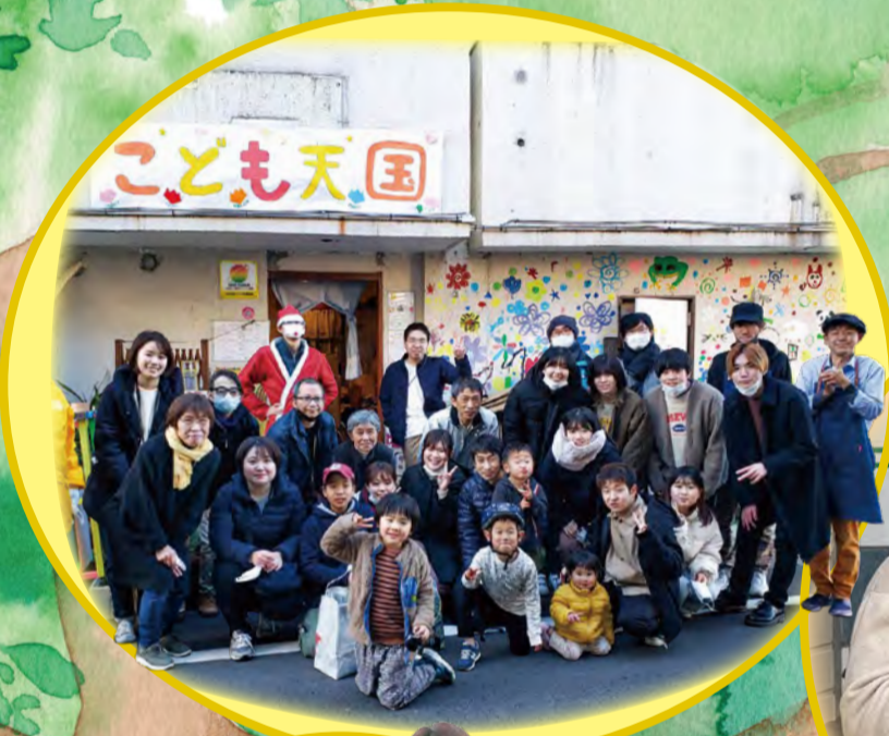
● 「子ども天国」での フードパントリーに 参加された皆さん