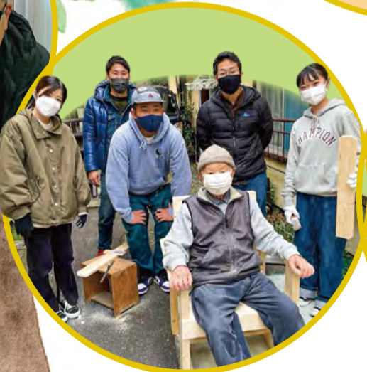
● 蒲田西プラットフォーム 「みんなのイスプロジェクト」に 参加された皆さん