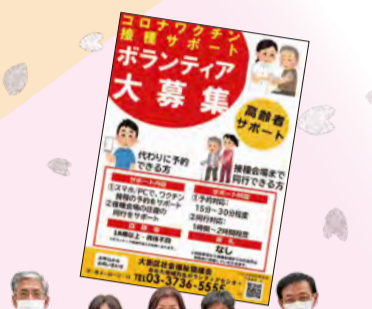
コロナワクチン接種サポートをしてくださった「大田スカイパソン同好会」の皆さん