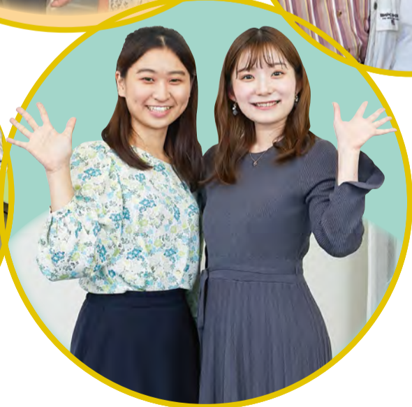
● 学生が運営する 子ども食堂「はちみつ食堂」で 活動しているお二人

大田区社会福祉協議会は、「互いに結びあい 共に支えあう まち」の実現に向けて、 地域の皆さまと力を合わせて大田区の地域福祉をすすめる団体です。