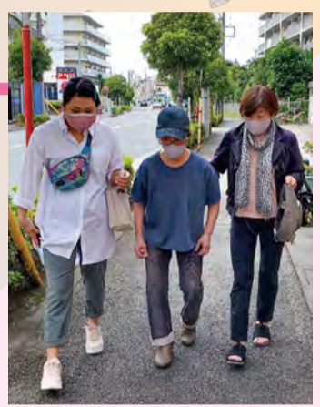
コロナワクチン接種サポート 同行ボランティア(左)

地域のボランティアによるコロナワクチン接種サポート(予約サポート・同行サポート)が始まりました。同行サポートでは、ボランティアの皆さんが利用者宅の往復を優しい声がけをしながら付き添ってくださいました。