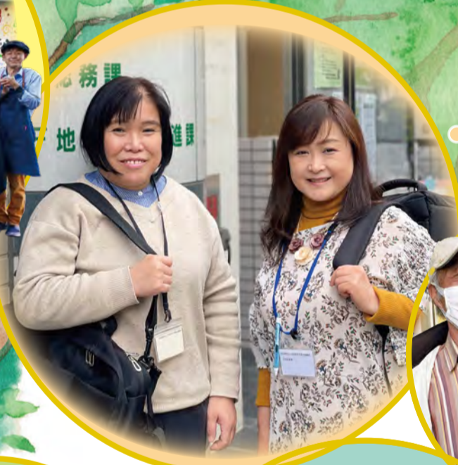
● 地域福祉権利擁護事業 生活支援員のお二人