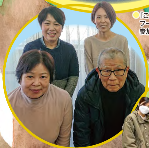
● 介護認定調査員の皆さん