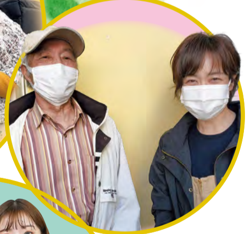
● コロナワクチン 接種サポート 同行ボランティア(右)