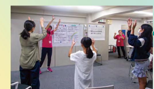
夏休み子ども手話教室の様子

「地域の新たなチカラ」地域貢献活動について考えてみよう」をテーマに、ゲストに地域活動団体の方々をお迎えし、オンラインイベントを6/30(水)に開催しました。企業の皆さんの持つ強みが地域に加われば、これほど心強いことはありません。コロナ禍の中、地域のために取り組んでくださる様々な企業の方々の活動内容を知る機会にもなりました。