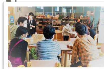
▲ ビンゴゲームを楽しむ様子

“リエット”とはイタリア語で「楽しい・愉快な・幸せ」という意味。ゆるやかに流れる安心できる時間・空間をコンセプトに、自由に楽しく過ごせるカフェを目指しています。見学も可能です。ご興味のある方は、ぜひご参加ください。ボランティアも募集中！お気軽にお問い合わせください。