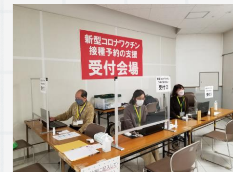
▲ アビクオーレ会場の様子

今後も、インターネットでの予約が困難な方を対象に、予約代行支援を行う予定です。お困りの方はご利用ください。詳しくは、接種通知や『広報あびこ』をご覧ください。