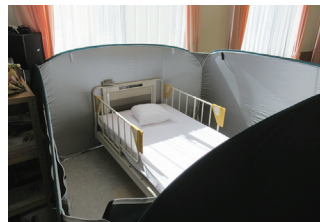
日赤 災害物資支援