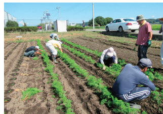
社協 民協農園の支援