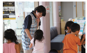
共募 サマーボランティア