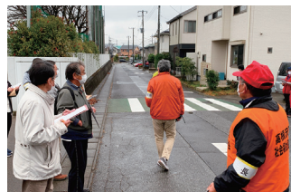
共募 防災まち歩き