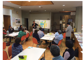
社協 志民活動応援