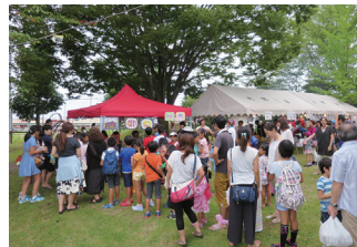
共募 自治会活動への助成