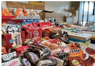
共募 フードバンク