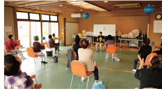
社協 はつらつ運動教室