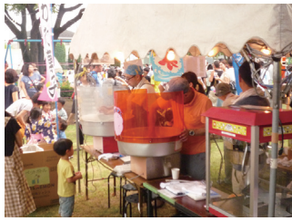
社協 イベント機材貸し出し