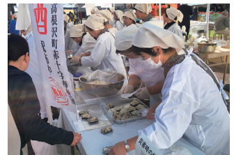
日赤 炊き出し訓練