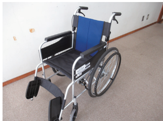
社協 介護用具貸し出し