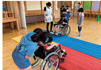
社協 学校での福祉学習