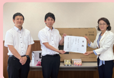
▲株式会社ダイナム 茨城土浦店・茨城石岡店・新治店 様