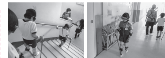
▲インスタントシニア体験の様子

こもればの会は平成元年に設立し、特別養護老ホームでボランティア活動をしています。お茶の接待や話し相手、施設の行事や外出の付添などで車いすを介助することもあります。ここ数年のコロナ問題で本来の活動ができなくなり、社協に相談して新しい活動を紹介して頂きました。小学校では高齢者を理解するためのシニア体験や車いす体験を授業に取り入れています。こもればの会は、お手伝いとして体験中の見守りと補助をするボランティアを令和4年から行っています。会員も高齢化してきました。孫のような小学生とふれあうことで、世代間交流にもなっています。