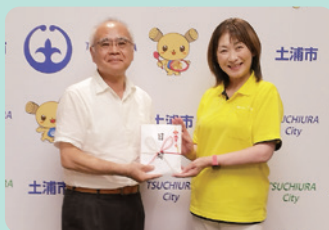
▲県南地域医療懇話会 様