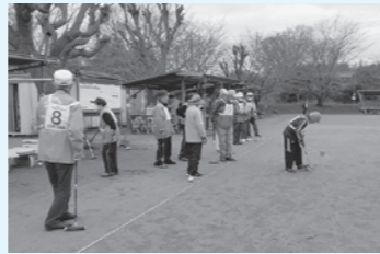
◆ゲートボール大会◆