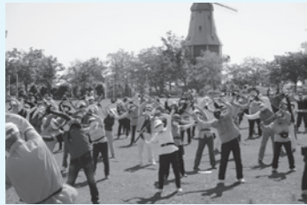
◆グラウンド・ゴルフ大会◆

ご近所で同じ趣味を持つ仲間と出会いたい方、なにか新しいことを始めたい方、地域でいきいきと活動したい方の入会をお待ちしております。