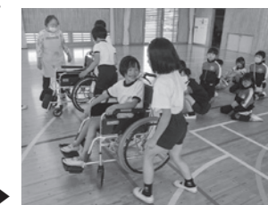
車いす体験の様子▶