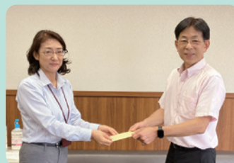
▲社会福祉法人祥風会 桜川保育園 様