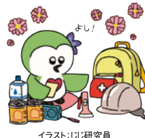
イラスト:じじ研究員