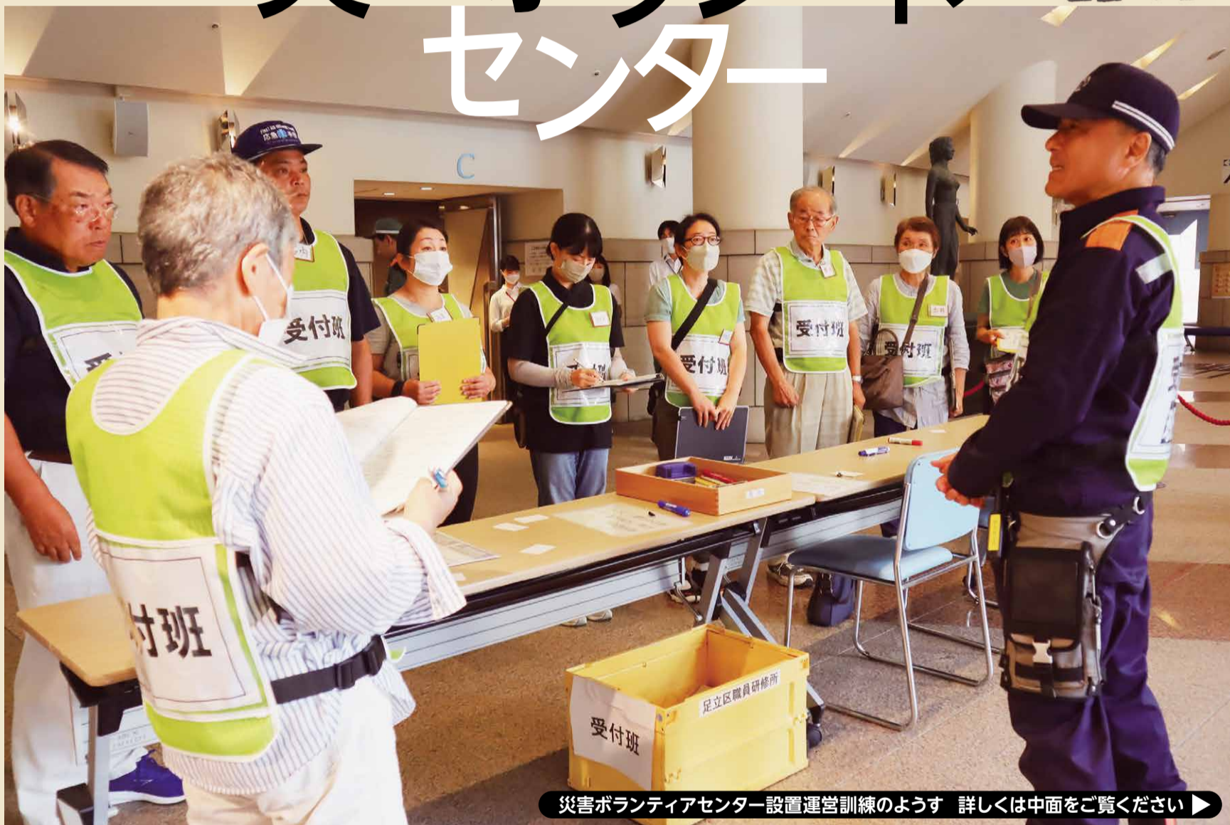
災害ボランティアセンター設置運営訓練のようす 詳しくは中面をご覧ください ▶