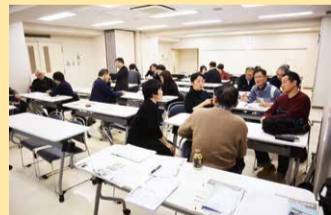
被災地支援のノウハウや体験談を聞くことができる災害ボランティア研修

お問い合わせ 総合ボランティアセンター TEL 3870-0061 FAX 3870-5900