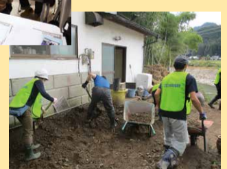
鹿沼市に派遣した災害ボランティア(2019年)