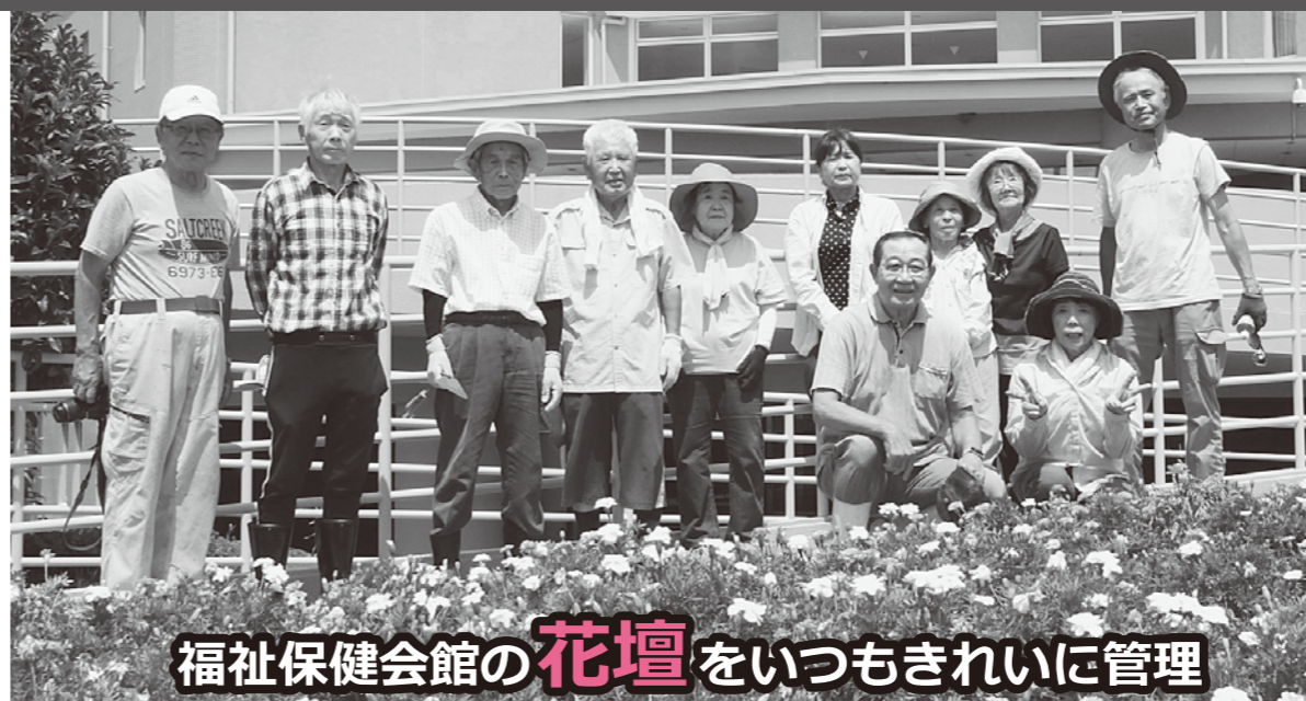
福祉保健会館の 花壇 をいつもきれいに管理

第23回 グランドゴルフ大会 154名参加 R5.7.28 上位3名と4位三ツ石親男(伊豆島田) 5位千田文雄(桃園)は県大会へ出場が決定!