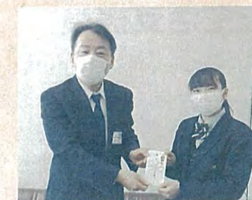
▲株式会社市岐商デパート