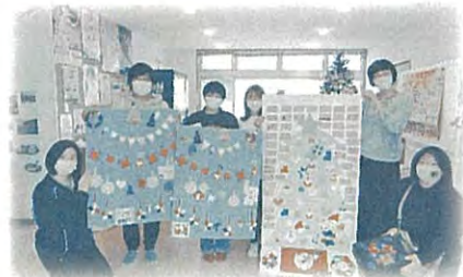
いつでも、どこでも、だれでも参加できるペンパーボランティア♪令和5年度も企画提案していきます!