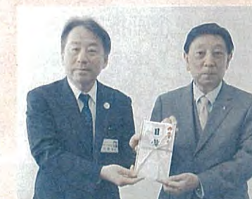
▲ぎふしん愛の募金