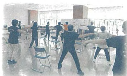
健康でいきいきとした生活を送れるよう介護予防教室などを開催しています。