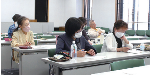
講師自身の経験も交えながらのわかりやすい説明に、メモを取る受講者。