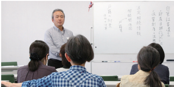
講義のあとは時間が許す限り相談会。「こんな場合はどうすれば?」と受講者からの質問が寄せられる。