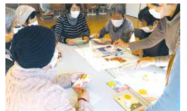
ふれあいいきいきサロン