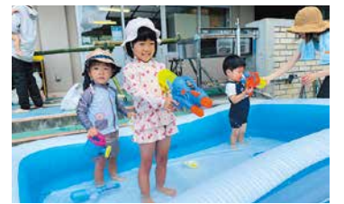
まちの子育てひろば