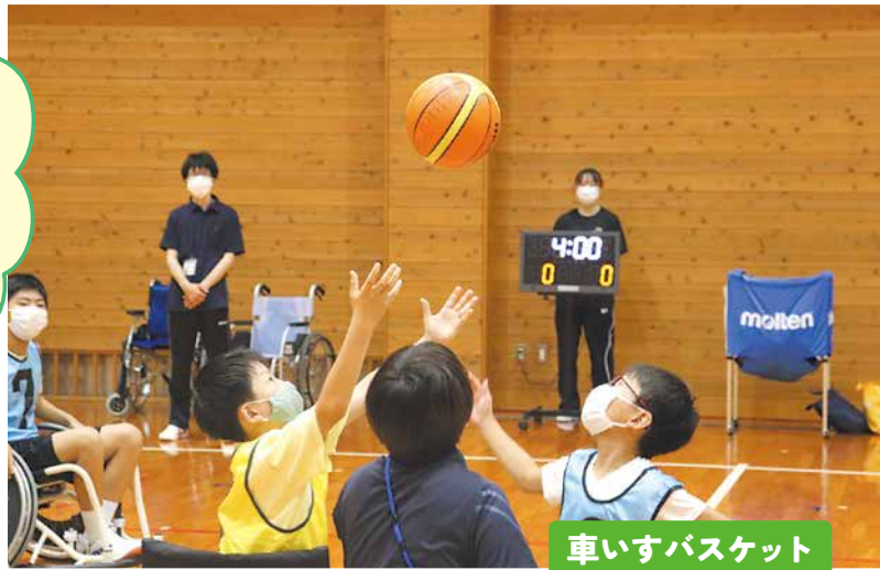
車いすバスケット