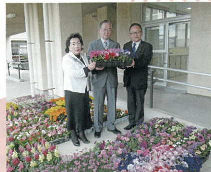
桐生典礼株式会社 様