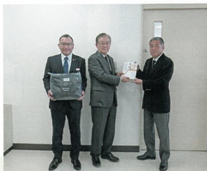
清水開発株式会社 様