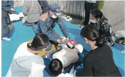
◀ 地域での自主防災活動