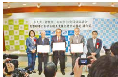
倉敷市・高知市社協との支援協定締結の様子