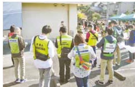
昨年度の訓練の様子

毎年9月1日は防災の日です。奈良市においても9月1日に災害対策本部訓練が実施されたほか、10月29日には総合防災訓練が実施される予定です。本会でも、近年行ってきた様々な取り組みを、訓練という形で実証し、思いやりや助け合いの精神による被災者へ寄り添う支援等、今後の災害支援体制づくりに活かしていきたいと考えています。