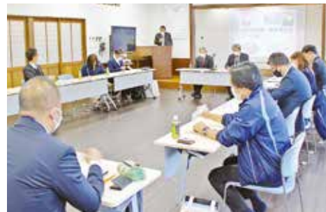
福井市との合同研修の様子