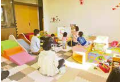
絵本の読み聞かせ♥