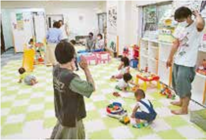
保護者同士で情報交換😊