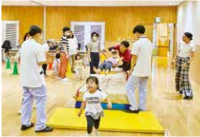
跳び箱、マット、平均台で遊ぼう♪