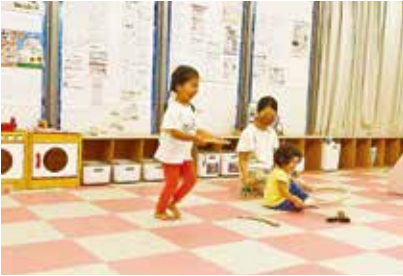
きょうだいで楽しく遊べます★