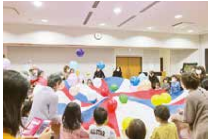
風船を飛ばして世代間交流♪