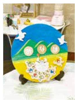
ボランティアさんの手作り